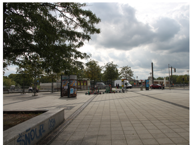
Foto 36: Blick in Richtung U-Bahnhof Hellersdorf mit Litfaßsäule und Jelbi-Punkt