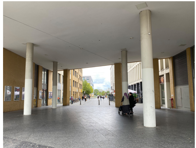
Foto 10: Unterführung zur Kurt-Weill-Gasse, Blickrichtung Fritz-Lang-Platz