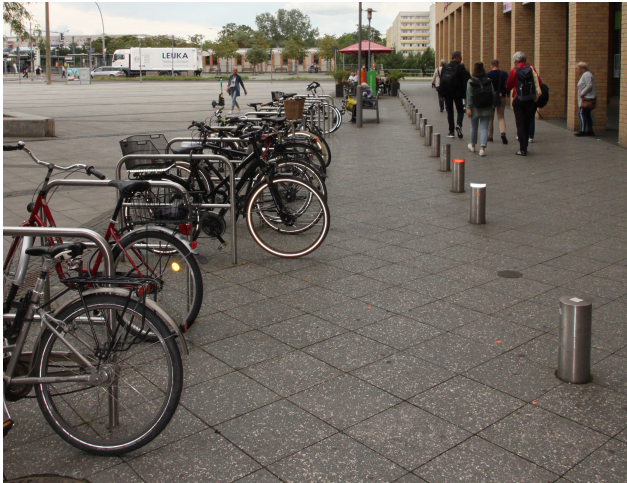
Foto 7: Fahrradstellplätze und Umfahrung entlang der westlichen Gebäudekante, Blickrichtung Hellersdorfer Straße