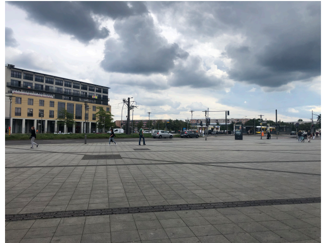
Foto 14: Blick auf den nordwestlichen Platz, Blickrichtung Kreuzungsbereich