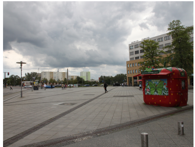
Foto 16: Blick auf den nordwestlichen Platz, Blickrichtung Hellersdorfer Straße