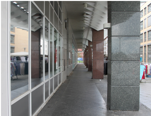
Foto 27: Arkadengang am „Marktplatz-Center“, Blickrichtung Peter-Weiss-Gasse