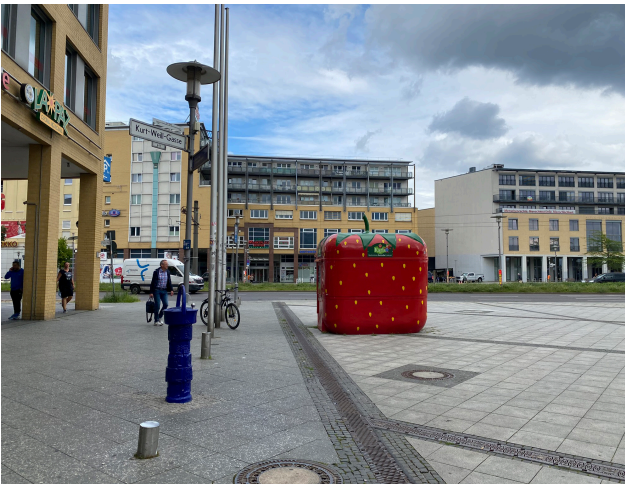
Foto 15: Blick auf den nordwestlichen Platz, Blickrichtung Stendaler Straße