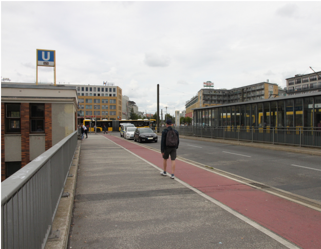
Foto 41: Stendaler Brücke mit U-Bahnhof und Straßenbahnhaltestelle, Blickrichtung Norden