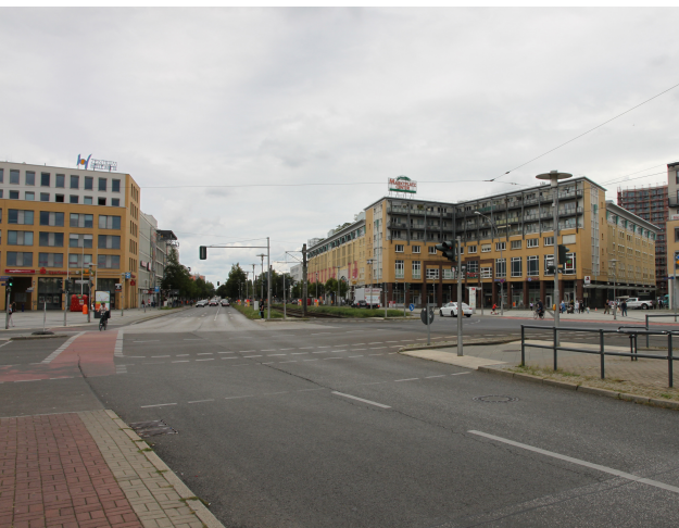
Foto 43: Kreuzung Rieser Straße / Hellersdorfer Straße / Stendaler Straße