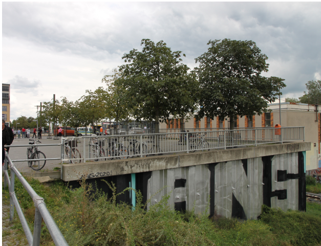
Foto 49: Südlicher Platz mit der Stützwand in Richtung Bahntrasse