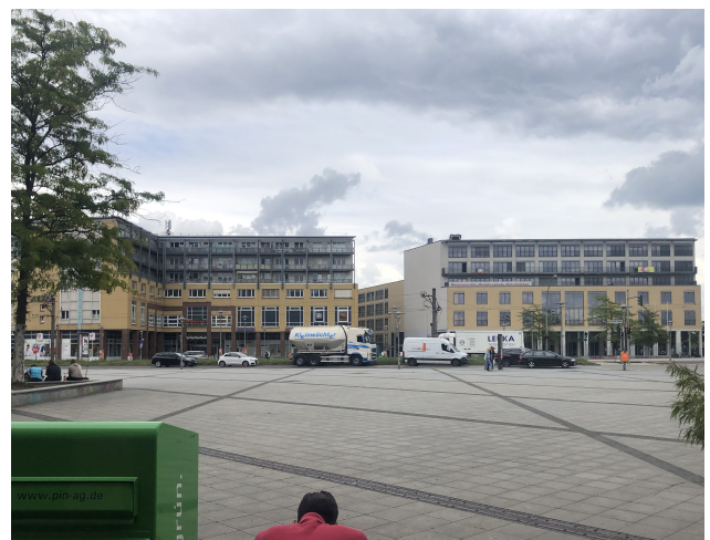
Foto 4: Stendaler Straße / Alice-Salomon-Hochschule und Marktplatz -Center, Blickrichtung Osten