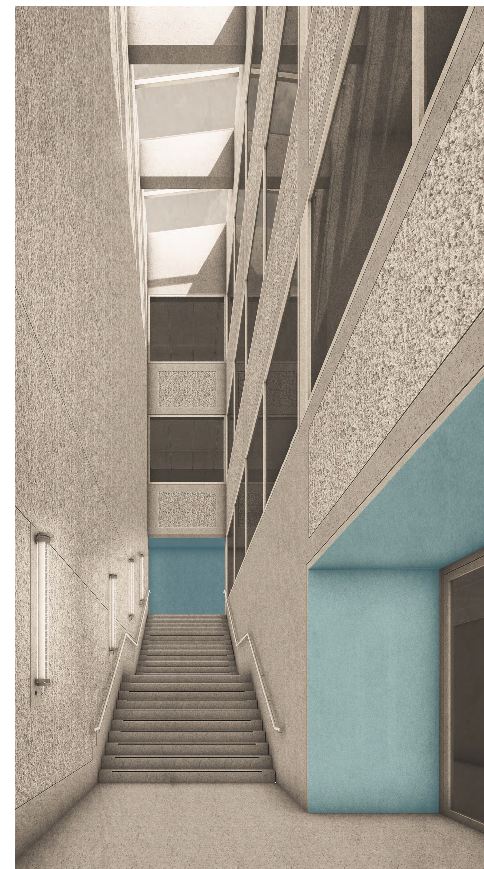
Perspektive Kaskadentreppe mit Markierung in Blau Wände Sichtbeton sandgestrahlt, Beton gestockt Boden geschliffener Sichtestrich, Sichtbetontreppe Verglasung Rahmen Stahl-/Aluprofile, pulverbeschichtet, RAL 7044 Seidengrau

Blau markierte Bereiche \hat{=} Flächen für Kunst am Bau