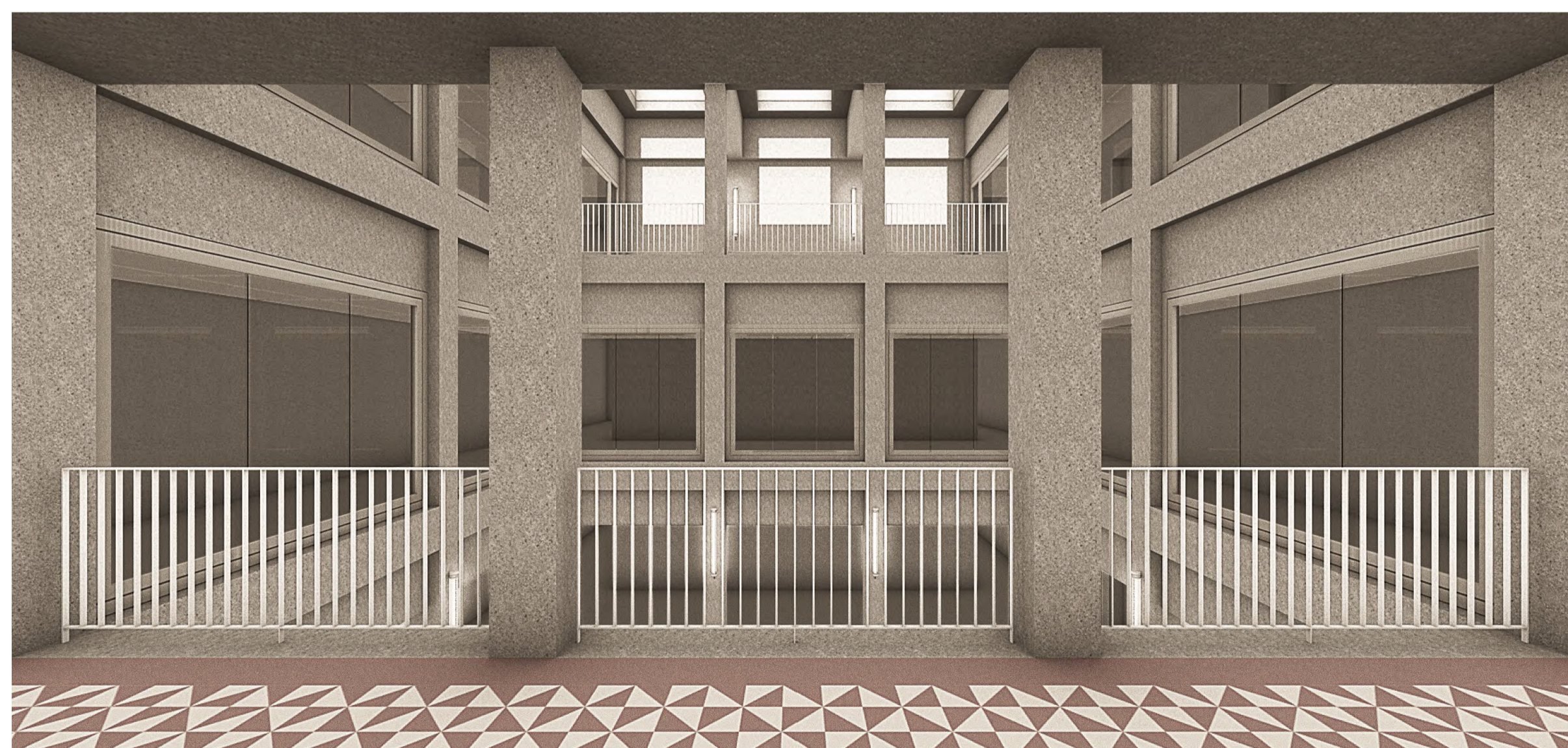
Perspektive Atrium mit Markierung in Blau Wände, Stützen, Decken Sichtbeton sandgestrahlt; Fußboden Zementfliesen Verglasung Rahmen: Stahl-/Aluprofile, pulverbeschichtet, RAL 7044 Seidengrau