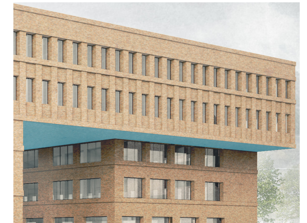
Blau markierte Bereiche ≙ Flächen für Kunst am Bau

Fassade Klinker, Rot; Fenster+Rahmen Alu-Profile, pulverbeschichtet, RAL 8017, Schokobraun Fläche Brückenunterseite Decke glatt, gestrichen, Rot analog Klinker