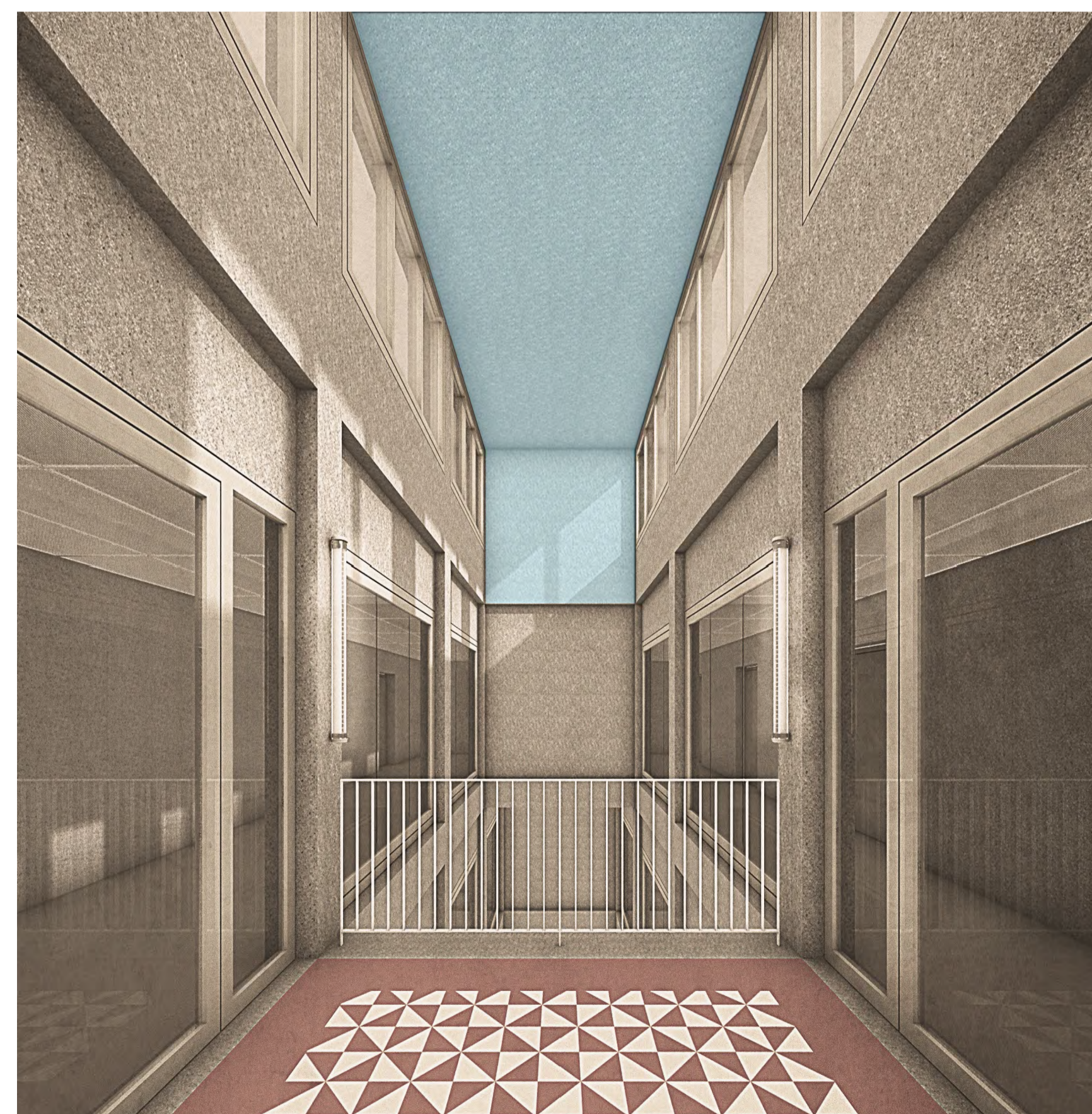
Perspektive Atrium mit Markierung in Blau Wände, Stützen, Decken Sichtbeton sandgestraht; Fußboden Zementfliesen Verglasung Rahmen Stahl-/Aluprofile, pulverbeschichtet, RAL 7044 Seidengrau