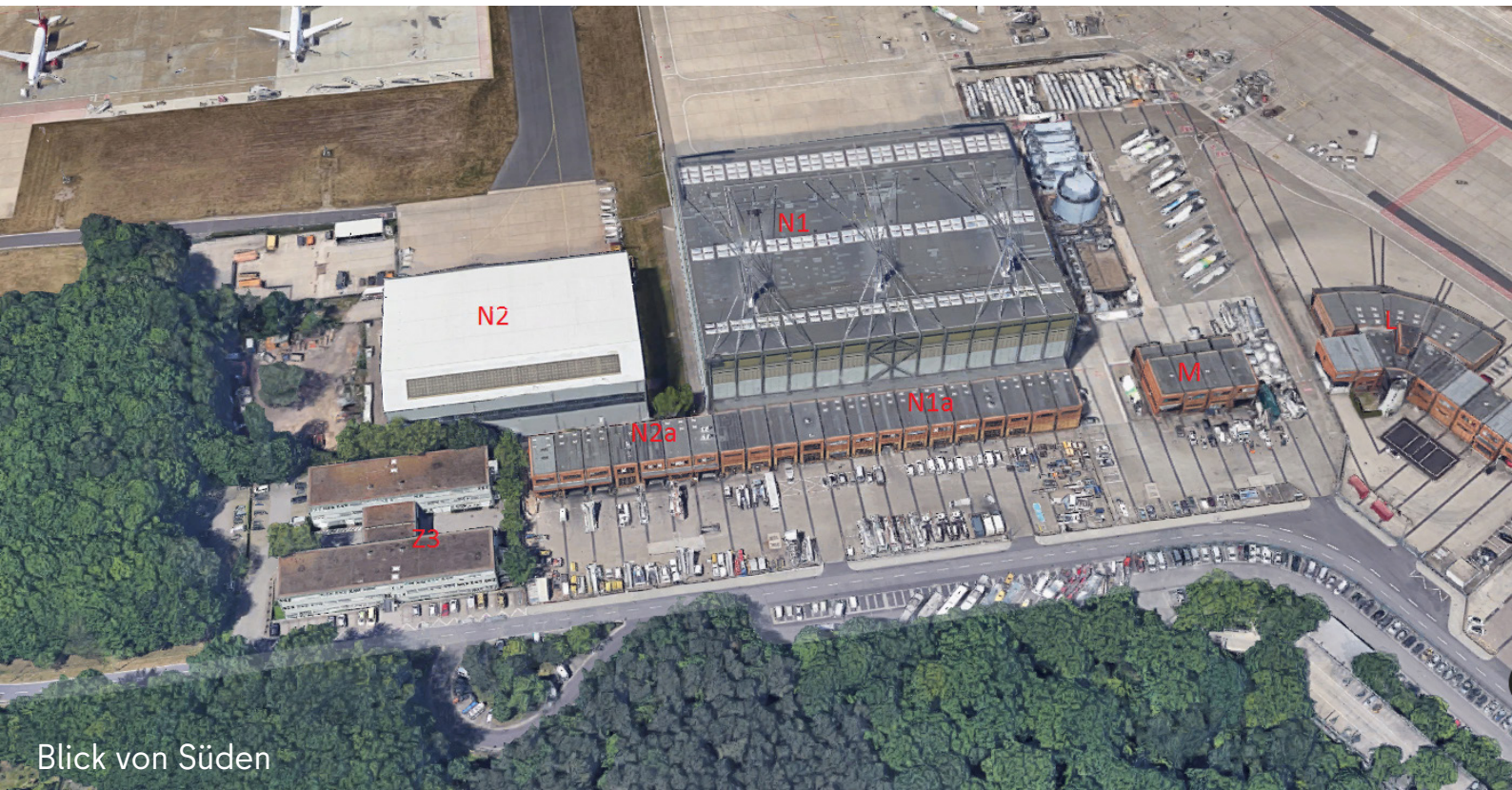
Blick von Süden