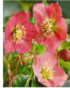
Helleborus x Orientalis 'Red Hybrids'