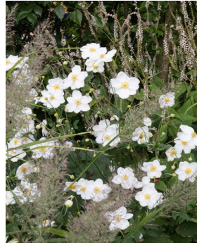
Anemone japonica 'Honorine Jobert'