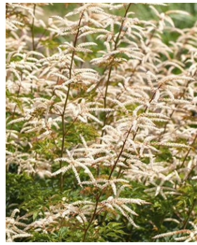
Aruncus aethusifolius 'Johannisfest'