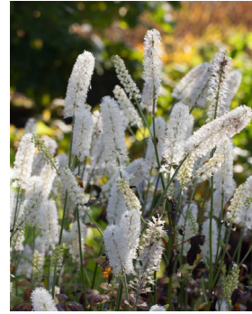
Cimicifuga simplex 'White Pearl'