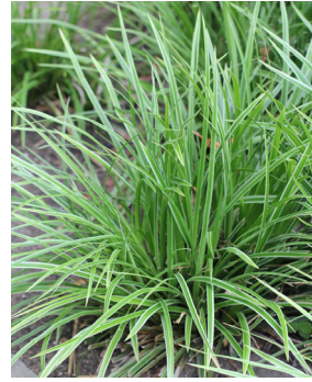
Carex morrowii 'Variegata'