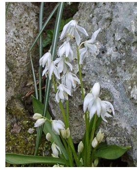
Scilla sibirica 'Alba'