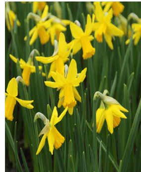
Narcissus 'February Gold'