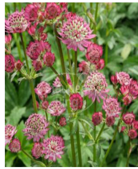
Astrantia major 'Cerise Button'