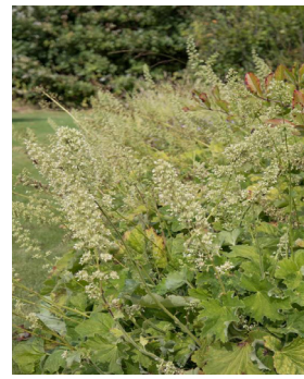
Heuchera villosa var. Macrorrhiza